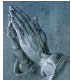
デューラー作 「祈り」の手 アルベルティーナ 美術館(ウィーン)

世界の3大宗教は、キリスト教 イスラム教 仏教。祈りの作法は違えども、祈る姿はみな美しく、今日も聴こえるアザーンのごとく相手の心を打ち、優しく響き渡ります。