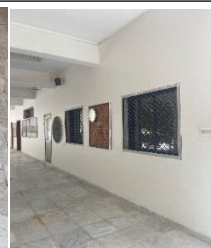
ディスプレイを床に貼り、壁もきれいにしました。