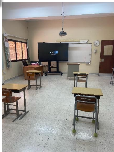
8月24日(火) 厳しい ADEK のインスペクションに合格し 2 学期始業準備ができました。

日本人会広報誌アザーン9月号でもご案内しますが、 10月17日(日) に予定しております2021年度第二回日本漢字能力検定は、コロナ感染対策の規制に伴い、二学期も、日本人学校の児童生徒のみを対象に実施させていただきます事をご了承ください。