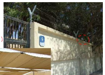
有刺鉄線と防犯カメラ

中東地域に住む日本人には、安全対策は重要なポイントです。大使館の指導や協力により、警備員の増員、塀への有刺鉄線の設置、防犯カメラの増設、セキュリティボックスの設置などが実現されました。有刺鉄線が塀に設置されているのは、アブダビの学校の中でおそらく本校だけです。また、サンシェード付きの人工芝グラウンドが整備されています。休み時間には全校児童生徒で鬼ごっこなどを楽しんでいます。