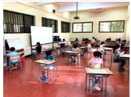
マスク、フェイスシールドそして授業に集中。