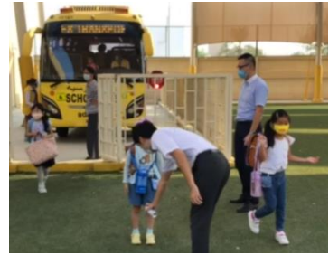
元気に登校。非接触型体温計で検温、ていねいに靴も消毒。