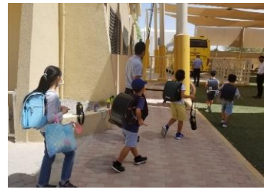
ソーシャルディスタンスを守って登下校。

安心・安全を第一に！ 隔週分散登校 9月、アブダビ日本人学校は隔週・分散登校で2学期がスタートしました。コロナ禍の新たな日常(学校生活)です。教室授業とオンライン自宅学習が1週間毎に代わります。児童生徒は防疫規制の中、健気に新たな日常に順応しています。10月には大切なテスト(中学定期テスト等)もありますね。家庭学習をしっかり積み上げ、実力をつけておきましょう。